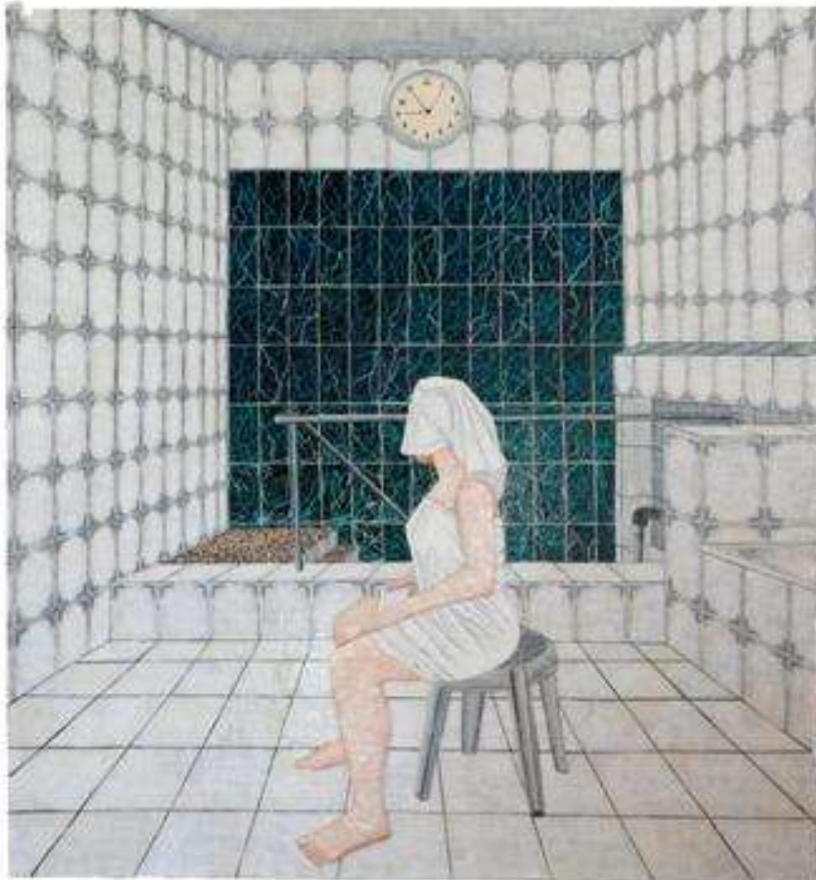
הילה קרבלינקוב, מקווה